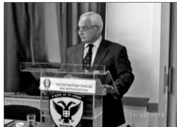
Ο Πρόεδρος του Δ.Σ. και έκθεση πεπραγμένων

Εκ των μελών, παρέστησαν Επίτιμοι Ανώτατοι Αξκοί όλων των κλιμακίων Επιτελείων και Σχηματισμών, Ιερολοχίτες, πολεμιστές των ΛΟΚ και των Μοιρών Καταδρομών, καθώς και νεώτεροι, μόνιμα στελέχη εν αποστρατεία και έφεδροι Καταδρομείς, Πεζοναύτες και Αλεξιπτωτιστές, υπό το «Πνεύμα των Ειδικών Δυνάμεων» το οποίο είναι υπεράνω βαθμών και διακρίσεων.