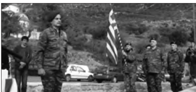
Κατάθεση στεφάνου Λέσχης Καταδρομέων και Ιερολοχιτών

Την Κυριακή 21 Ιανουαρίου 2018 τελέσθηκε η επιμνημόσυνη δέση στον ναό της πόλεως του Λεωνιδίου για