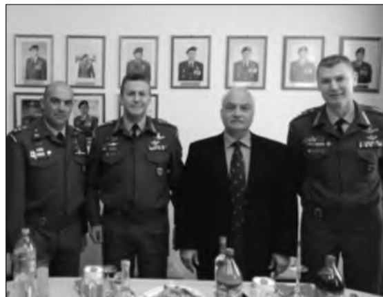
Ο Πρόεδρος της ΛΚΙ σε αναμνηστική φωτογραφία.

Στις 9 Μαρτίου 2018, ο πρόεδρος του ΔΣ της Λέσχης Καταδρομέων και Ιερολοχιτών, συμμετείχε ως προσκεκλημένος και πρώτος διοικητής στον ετήσιο εορτασμό των Αγίων Σαράντα Μαρτύρων, προστατών της Ζ' Μοίρας Αμφιβίων Καταδρομών.