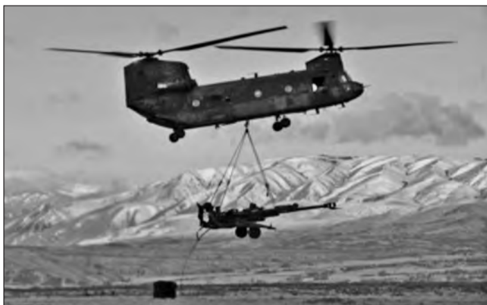
Μεταφορά ενός οβιδοβόλου M77A2 των 155 χιλ. από Ε/Π Chinook