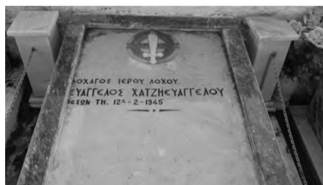
Τάφος Ε. Χατζηευαγγέλου (Εμπορειός Νισύρου)

παλληκάρι κι αγωνίζονταν να συγκρατήσει κάποια υποψία λυγμού που ετρεμόπαζε μες στη φωνή, μια φωνή τραχειά, συνηθισμένη σε κοφτά πολεμικά παραγγέλματα. Και είδα τα βλέμματα όλων εκείνων των πολεμιστών που είχανε δει πολλές φορές τον Χάρο και στο Αιγαίο και στην Τύνιδα και στην σκληρή έρημο και στην Αλβανία και στο Ρούπελ και στη Μικρασία μερικοί, τα είδα να υγραίνονται από συγκίνηση.